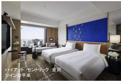
ハイアット セントリック 金沢 ツイン32平米