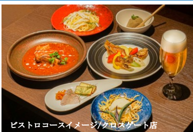
ビストロコースイメージ/クロスゲート店