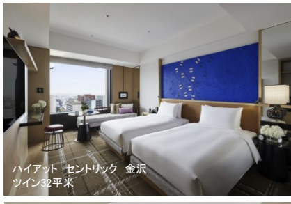
ハイアット セントリック 金沢 ツイン32平米