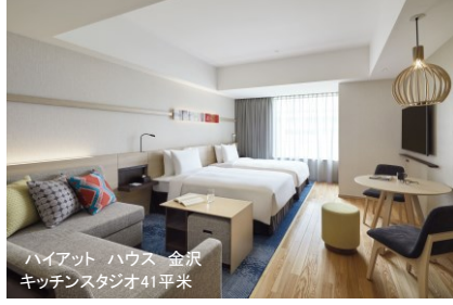
ハイアット ハウス 金沢 キッチンスタジオ41平米