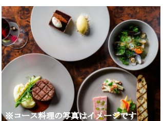
※コース料理の写真はイメージです