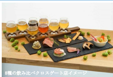
8種の飲み比べクロスゲート店イメージ