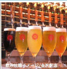
飲み放題イメージ/金沢駅店